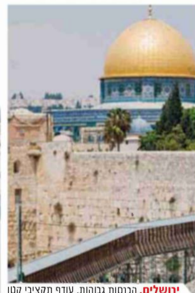
ירושלים. הכנסות גבוהות, עורך תקציבי קטן