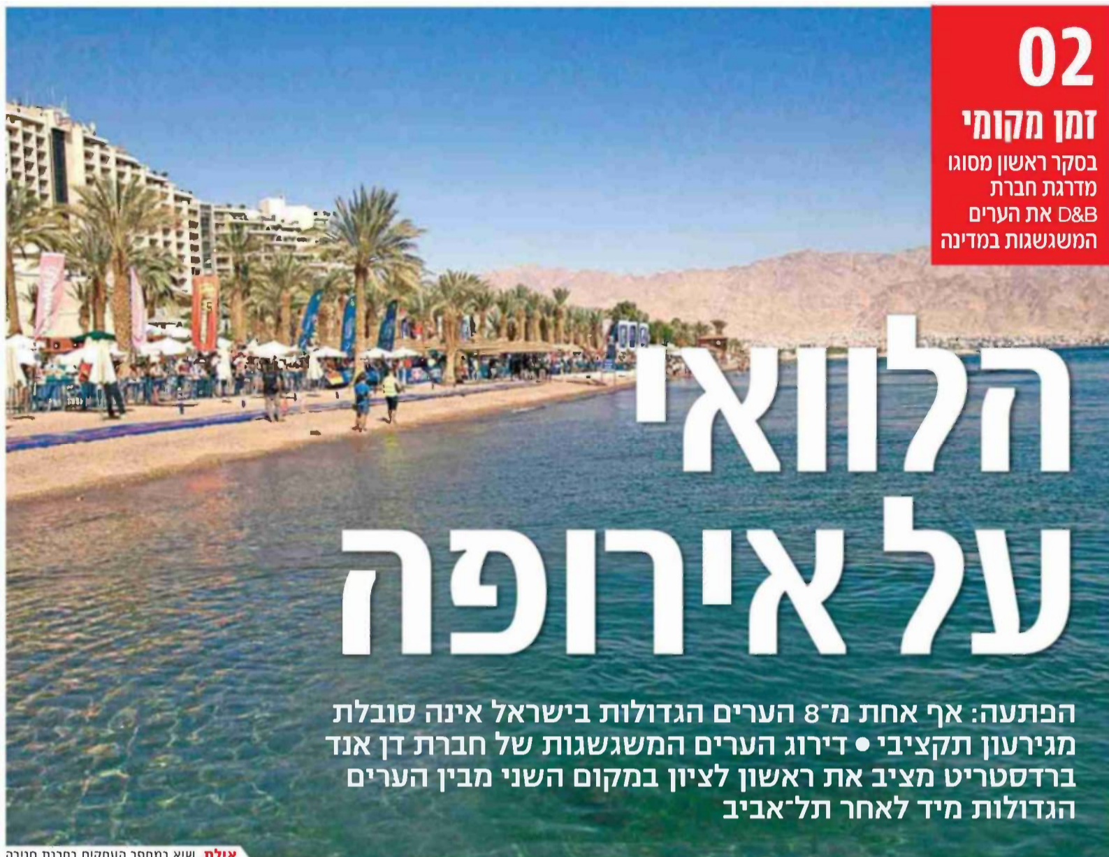
אילת. שיא במספר העסקים בסכנת סגירה

הפתעה: אף אחת מ־8 הערים הגדולות בישראל אינה סובלת מגירעון תקציבי • דירוג הערים המשגשגות של חברת דן אנד ברדסטריט מציב את ראשון לציון במקום השני מבין הערים הגדולות מיד לאחר תל-אביב