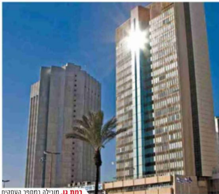
רמת גן. מובילה במספר העסקים