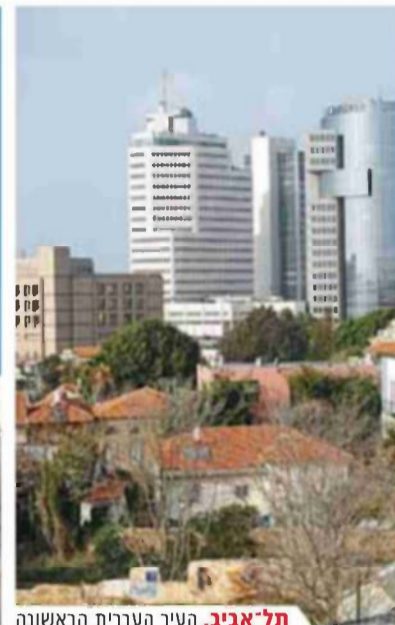
תל-אביב. העיר העברית הראשונה