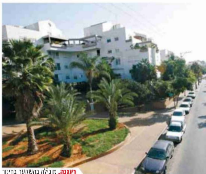
רעננה. מובילה בהשקעה בחינוך